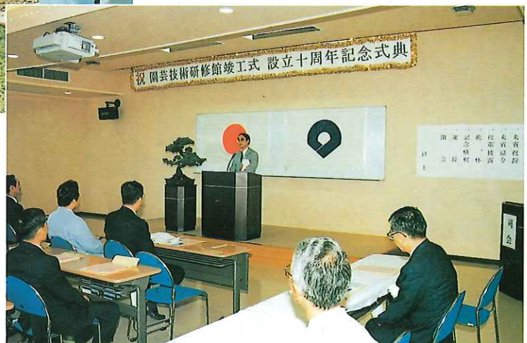
竣工式及び記念式典