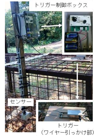
図1 赤外線センサー式の電子トリガー取り付け例

農地周辺でのイノシシ、シカの捕獲には箱わな、囲いわなを用いる事例が多くあります。箱わなでイノシシを捕獲する際、母親と子供の群れがわなに近づくと、警戒心の少ない子供だけが箱わなの中に入り、えさの中などに隠した低い位置の仕掛け（けり糸）に触って扉を落としてしまうことがあり、取り逃がした親の警戒心を高めてしまいます。また、イノシシは年に1回、春に出産しますが、春から夏に子供だけを捕獲すると秋にも出産することがあり、捕獲の効果が表れにくくなります。そのため親を含めて捕獲することが大切です。