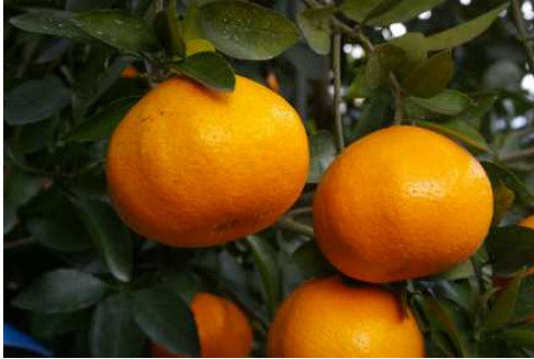
図1 ‘和果試交雑第1号’の果実