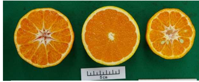
和果試交雑第1号 清見 中野3号ポンカン 図2 ‘和果試交雑第1号’および対照品種の果実断面