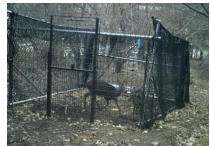
図3 試作したワナで捕獲されたシカ