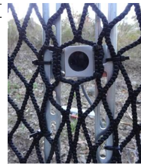
図2 電子トリガーのセンサー部のネットへの取り付け