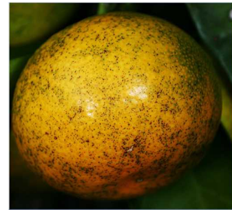
写真1 黒点病による果実被害

黒点病は温州みかんにおける主要病害で、発生すると果実の外観が損なわれ、販売価格が低下します（写真1）。本病の防除には主にマンゼブ剤 600 倍液（商品名：ジマンダイセン水和剤等）が使用されます。本剤は散布後の累積降雨量が 200～250mm に達するまで効果が持続しますが、近年、250mm 以上の集中豪雨が増加傾向にあり、耐雨性に優れた防除法が求められています。そこで、多雨条件下でも効果的な黒点病の防除対策の確立を目的に試験を行いました。