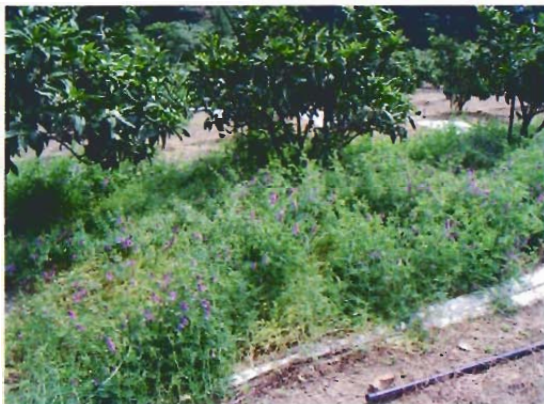
写真1 5月上旬の草生状況