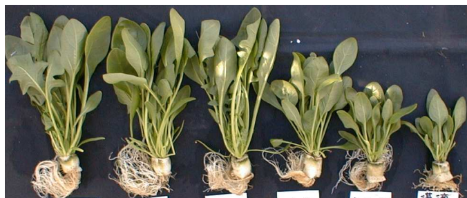
15℃昼夜 15℃夜 20℃昼夜 20℃夜 無制御 無制御 毛管水耕 湛液水耕

注) 給液は両端のかん水チューブで行い、余剰の培養液は根面を流れ、中央湛液槽から培養液タンクへ排水される