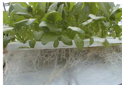
写真2 毛管水耕栽培ハウレンソウ