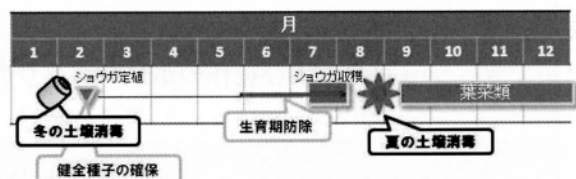
図2 ショウガ根茎腐敗病に対する防除体系(例)

これまでの試験結果から、ショウガ根茎腐敗病の防除効果には特に土壤消毒の影響が大きいこ