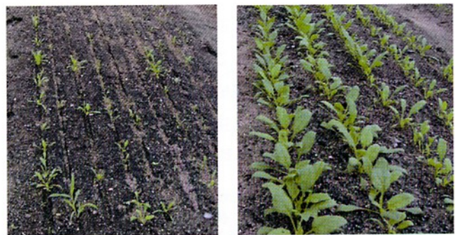
写真1 ショウガ根茎腐敗病汚染土壤において土壤消毒の有無がホウレンソウの生育に与える影響 注) 左：無処理区、右：太陽熱消毒区

注) 土壤消毒は16㎡/区とし、各時期に深さ30cmまでの土壤をオーガーで採集し、供試した。表中「+」は選択培地上で Pythium 属菌の検出があったこと、または生物検定での立枯発生があったことを、「-」はなかったことを示す。