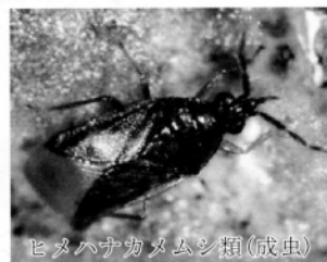
ヒメハナカメムシ類(成虫)