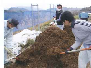
③全体に混ぜながら積みあげ軽く踏み固めて形を整えます