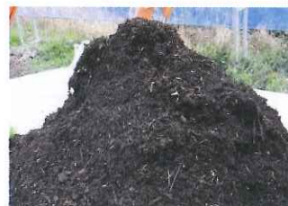
⑤8ヶ月おくと200kg程度の完熟堆肥になります