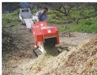
①せん定枝250kg分をチップパーにかけます