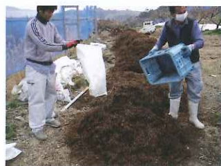
②発酵鶏糞60kgを混ぜます