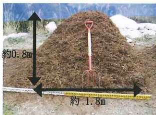
④下から染み出るくらい水をかけます