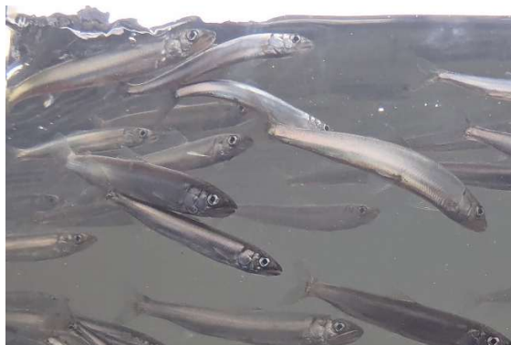
(遡上するアユの稚魚)