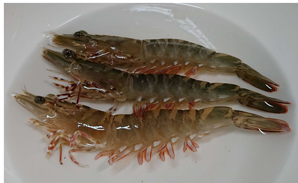
(水産試験場で育成したアシアカエビ)