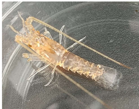
(イセエビのプエルルス幼生)