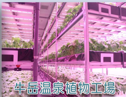
牛岳温泉植物工場