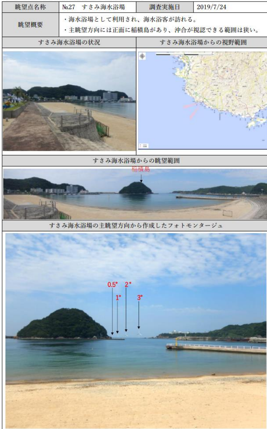
【別表1】眺望点からの景観(フォトモンタージュ)