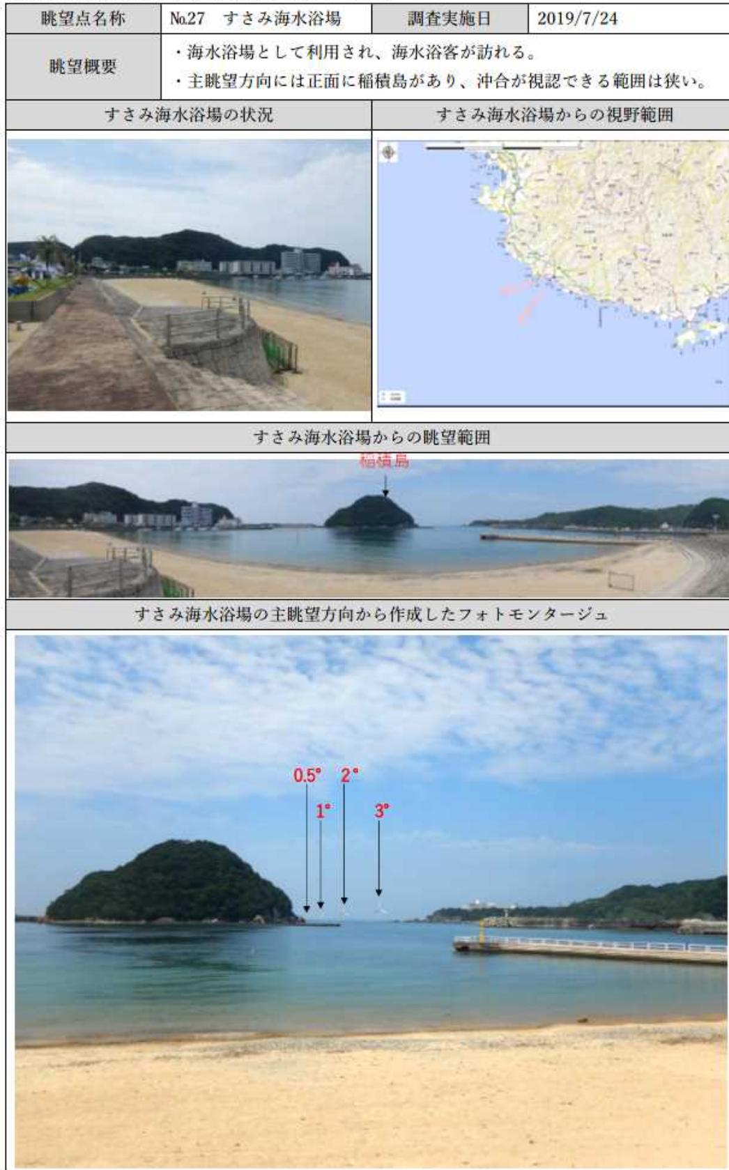
【別表1】眺望点からの景観(フォトモンタージュ)