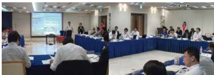
※過去のマッチングイベントの様子