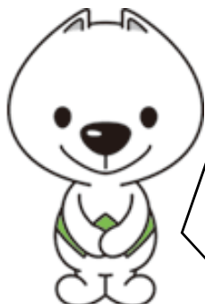
きいちゃん 和歌山県PRキャラクター