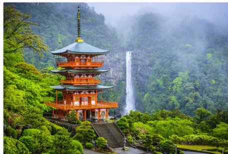
Tourism in Wakayama is managed sustainably