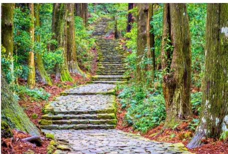
Follow ancient trails through Wakayama's primeval forests

Martin believes that by allowing visitors to stay with Buddhist monks at Kōya-san, where you wake early to meditate and eat local, sustainable vegetarian food, and managing the diving amongst the coral of Kushimoto and Shirahama in a sustainable way, Wakayama makes use of the world as it is. “Here life has another rhythm,” he says, “and the beauty of nature reigns supreme.”