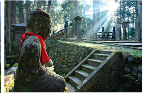
The monks at Koyasan in Wakayama make use of the world as it is