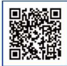
オンラインセミナー

※ オンラインセミナーを申し込まれた方には、後日、申込時のメールアドレスに参加用のURLを記載したメールを送信します。当日は13:10から受付を開始しますので、URLをクリックしてご参加ください。