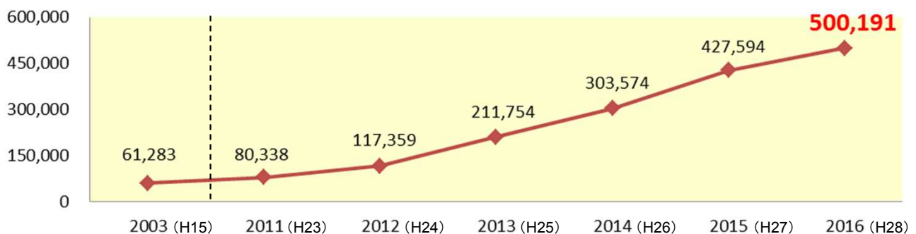
○県内外国人宿泊者数の推移(国・地域別)