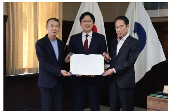
（左から）岸本知事、岡田社長、尾花市長の記念撮影