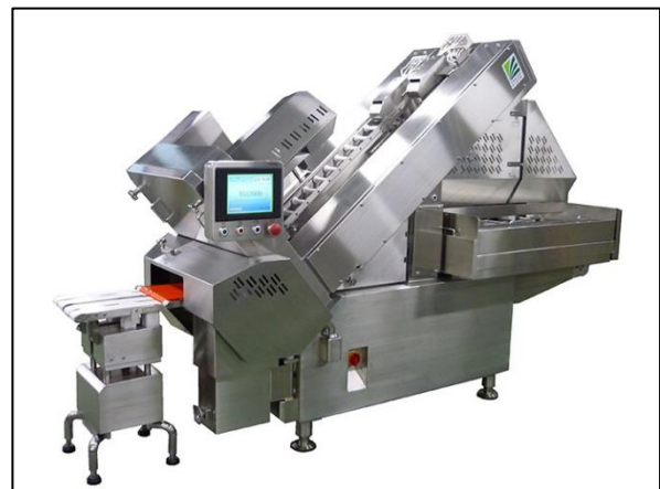
ハム・ベーコン用スライサー