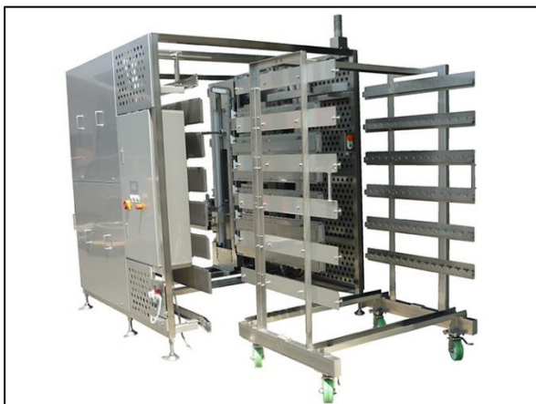
ウインナー自動竿積載装置