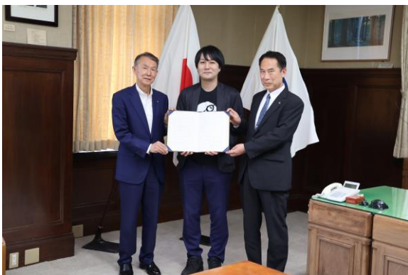
岸本知事、松野社長、尾花市長の記念撮影