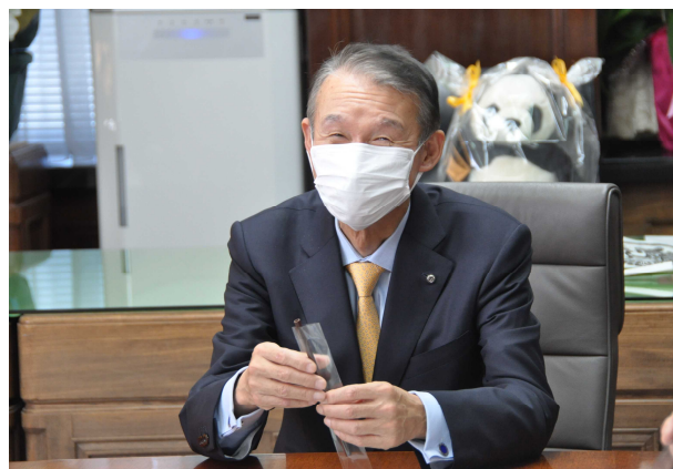
チョコストローを手に取る岸本知事