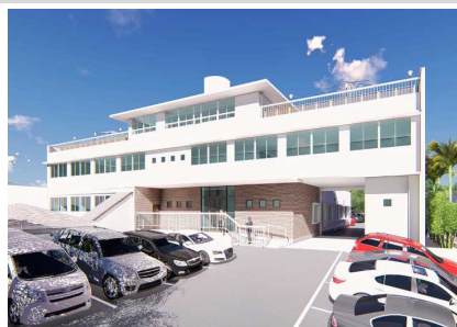
ITビジネスオフィス「ANCHOR」