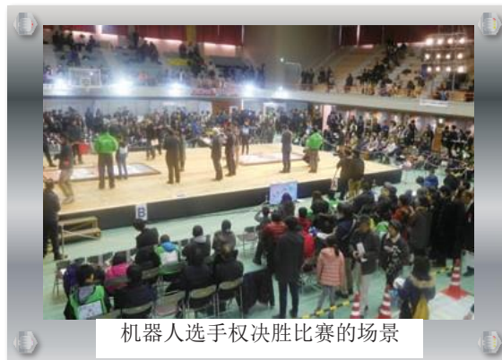
机器人选手权决胜比赛的场景