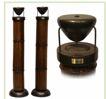
たけすびーかー かぐや [竹スピーカー Kaguya] (ウメダ電器)

いぶした竹をエンクロージャーとした無指向性スピーカーです。音響的に優れ、目の前で演奏しているようにリアルな音です。