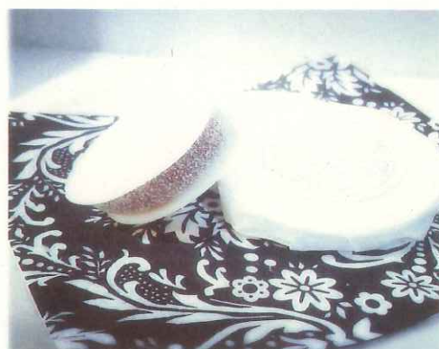
投稿者: tamarie.727 様 撮影商品: 五十五万石 (うたや)