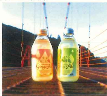
撮影商品: 生姜丸しぼり Wakayama Ginger Ale (わかやま農業協同組合)