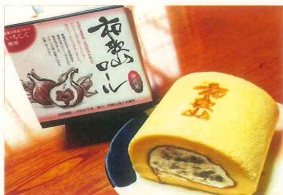
撮影商品: 和歌山ロール (きたかわ商店)