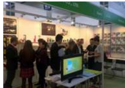
<香港ハウスウェア・フェア>