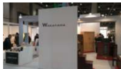
<IFFT/インテリアライフスタイルリビング>