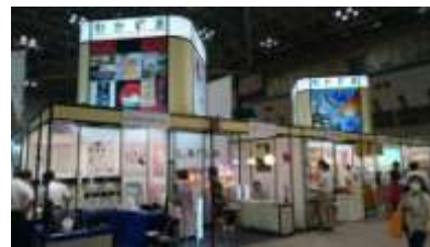
<東京インターナショナル・ギフト・ショー>