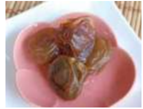
蜂蜜と砂糖を用いた梅グラッセ