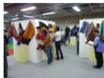
<東京レザーフェア>