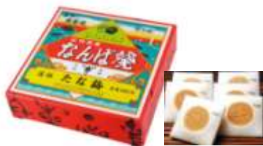
平成27年度特別賞受賞推奨品 「なんば焼」