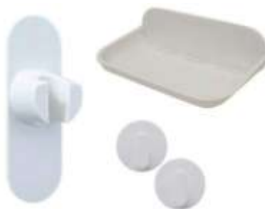
マグネット式の浴室グッズ