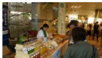
プレミアム和歌山紀州館（東京交通会館）