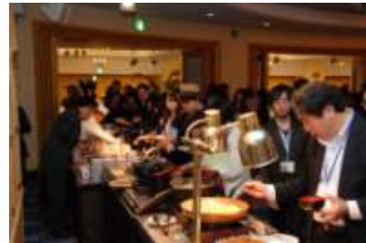
プレミアム和歌山セレモニー (H27. 11 都内ホテル)

○プレミアム和歌山パートナー（文化人、芸能人など各界に影響力を発揮できる方）を通じた、プレミアム和歌山の販売促進活動の展開