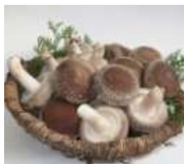
平成27年度特別賞受賞推奨品 「しいたけ（菌床栽培）」