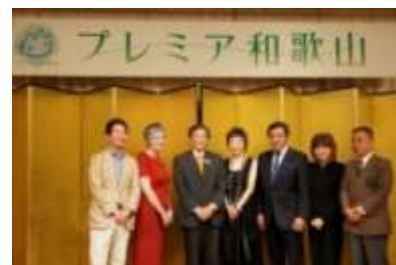
プレミアム和歌山セレモニー (H26. 10 都内ホテル)