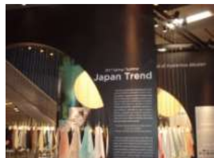
<ミラノウニカ・ジャパンパビリオン>