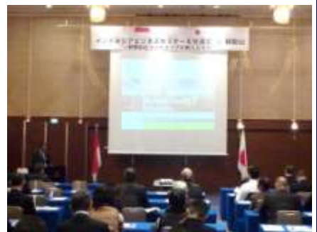
<インドネシアセミナー>

平成27年に実施したモンゴルビジネスミッションを契機に相互交流を深め、モンゴルからの訪問団受入れ等を実施