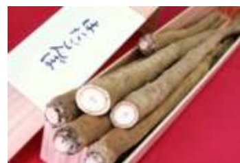
平成26年度特別賞受賞推奨品 「幻のはたごんぼ」