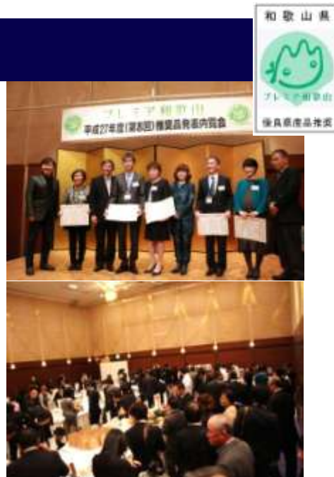
H27年度（第8回）プレミア和歌山推奨品記者発表内覧会