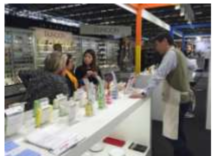
<メゾン・エ・オブジェ>