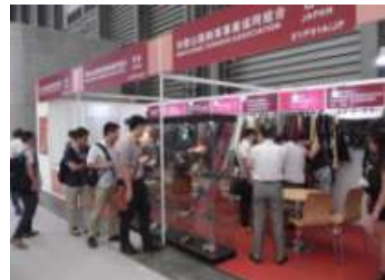
<オールチャイナ・レザー・エキシビジョン(上海)>