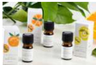
FRAGRANT KISHU - WAKA