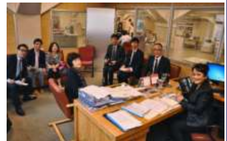
<トルコビジネスミッション>

世界第4位の人口を擁するASEAN大国で、和歌山県と津波防災関連での関係が深いインドネシアでセミナーや商談会等を実施