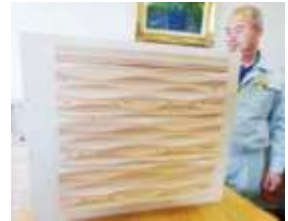
調湿機能の高い壁面パネル