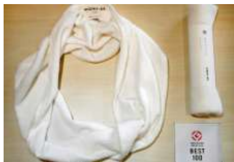
ニット生地の大中小（メリヤス）タオル