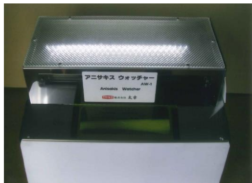
アニサキスウォッチャー