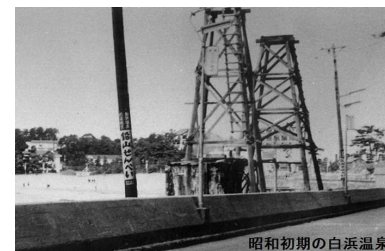
昭初期の白浜温泉