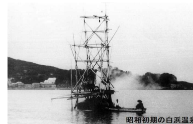
昭初期の白浜温泉