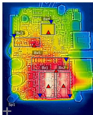
サーモグラフィでの 温度分布