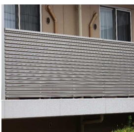
P型格子(風切音対策)施工