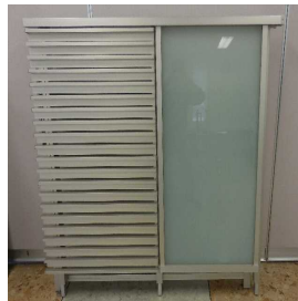
P型格子と硝子の組み合わせ製品