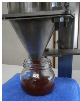
①ジャム 粘性の低いもの