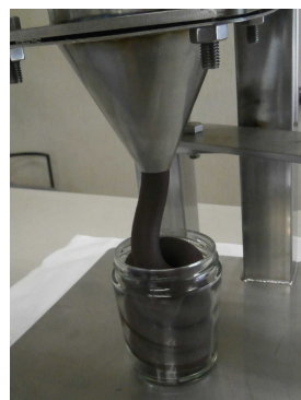
②味噌 粘性の高いもの