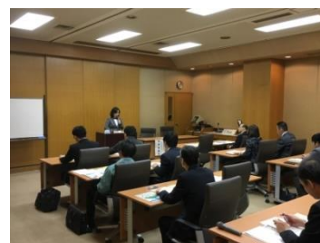
正社員化セミナー (2019.8開催)