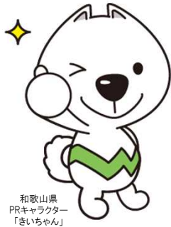
和歌山県 PRキャラクター 「きいちちゃん」