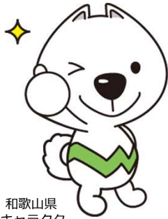
和歌山県 PRキャラクター 「きいちゃん」