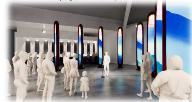
<和歌山ゾーンイメージ>