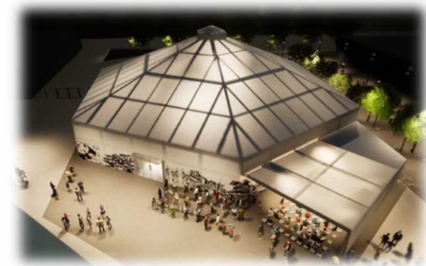
<関西パビリオンイメージ>