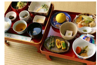
※上段：普賢院本堂、研修部屋、広間 ※下段：宿泊部屋、大浴場、精進料理（いずれも一例）