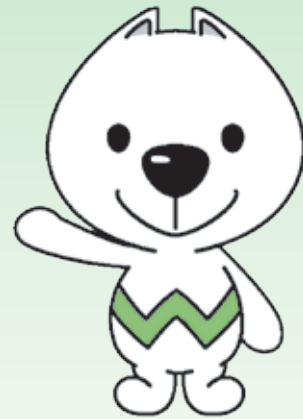
和歌山県PRキャラクター 「さいちゃん」