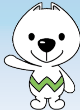
和歌山県PRキャラクター 「きいちゃん」