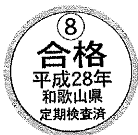
定期検査合格ラベル