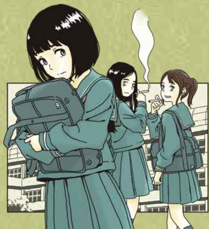
イラストデザイン: みずす MIZUSU (和歌山県出身)

和歌山県・和歌山県警察 和歌山県薬物乱用対策推進本部 和歌山県薬物乱用防止指導員協議会