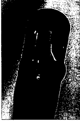
Figure 1: ERCP用内視鏡の先端 (拡大)