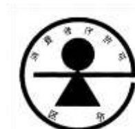
(b) 特別用途食品の標識

以上に述べた(a) 保健機能食品、(a) ① 特定保健用食品、(a) ② 栄養機能食品、(a) ③ 機能性表示食品、(b) 特別用途食品（特定保健用食品を除く。）の規制上の関係を図示すると次表のとおりとなる。