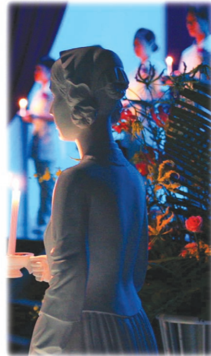
ナイチンゲール像