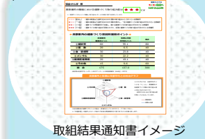
取組結果通知書イメージ

自社の健康づくりの取組割合を見える化し、次年度以降の取組の参考にしていただけます。