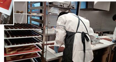
オリジナルボンボン作成