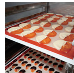
和歌山産はっさくの オレンジット