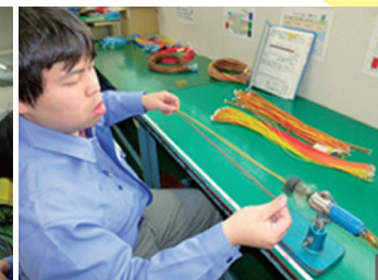
各種ハーネス作成