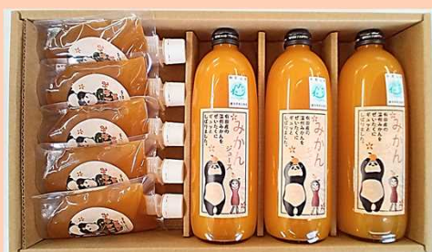
03-B／ジュースとちゅーるセット