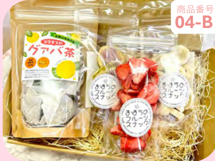
商品番号 04-B グアバ茶とまほうの フルーツスナックセット