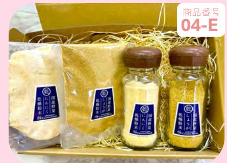
商品番号 04-E 乾燥にんにく・ 乾燥しょうがセット