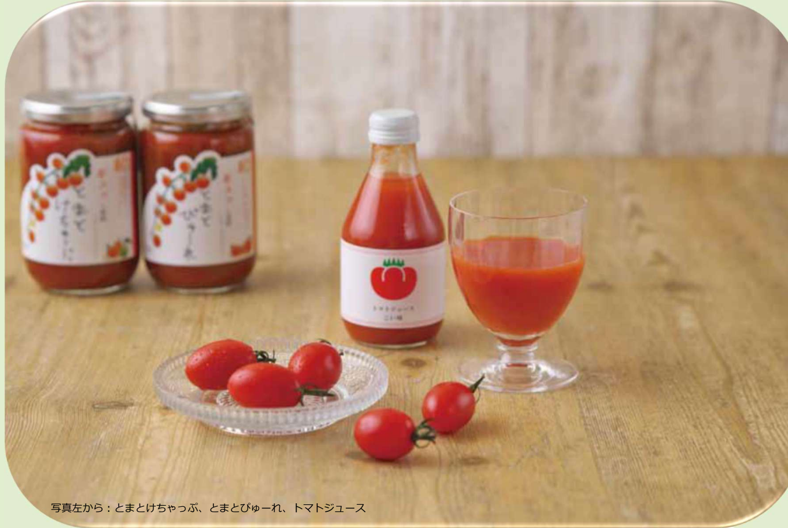
写真左から：とまとけちゃっぷ、とまとぴゅーれ、トマトジュース