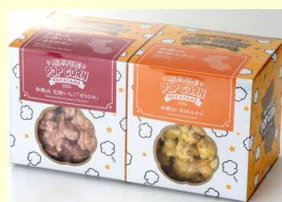
商品番号 PA!PI!PU!PE!POPCORN 16-C (和歌山フルーツセット)