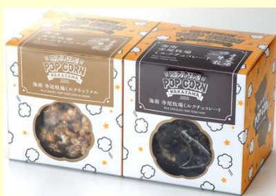
商品番号 PA!PI!PU!PE!POPCORN 16-B (海南市寺尾牧場セット)