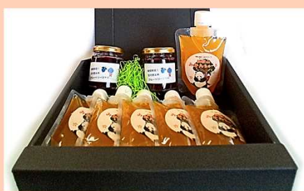
03-A／ちゅーるとジャムセット

海からの温かい風と、陽射しをいっぱい浴びて育った地元・有田地方のみかんをそのまま搾っています。糖度・栄養価が高く、日持ちがするので夏でも冬でも喜ばれるジュースの詰め合わせギフトです。