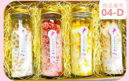
商品番号 04-D コスモスの天使セット