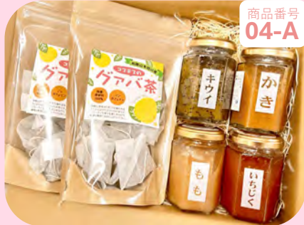
商品番号 04-A グアバ茶と ジャムセット

色鮮やかなジャムや、どんな方でも気軽にサクサク楽しめる フリーズドライフルーツを爽やかなグアバ茶とセットにしました。 ぜひ見た目も楽しい♪食べてもおいしい♪を感じてください！