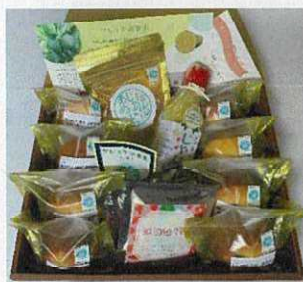
11/わかやま焼き菓子セット

県産のじゃばらをふんだんに使用したギフトセット！ 「じゃばらマフィン」はしっとりさせるため蜂蜜をたっぷり使用 しました。