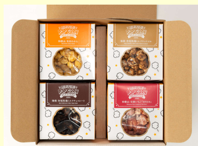
商品番号 PA!PI!PU!PE!POPCORN 16-A (ギフトセット)