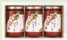
01-C/たっぷりとまとセット