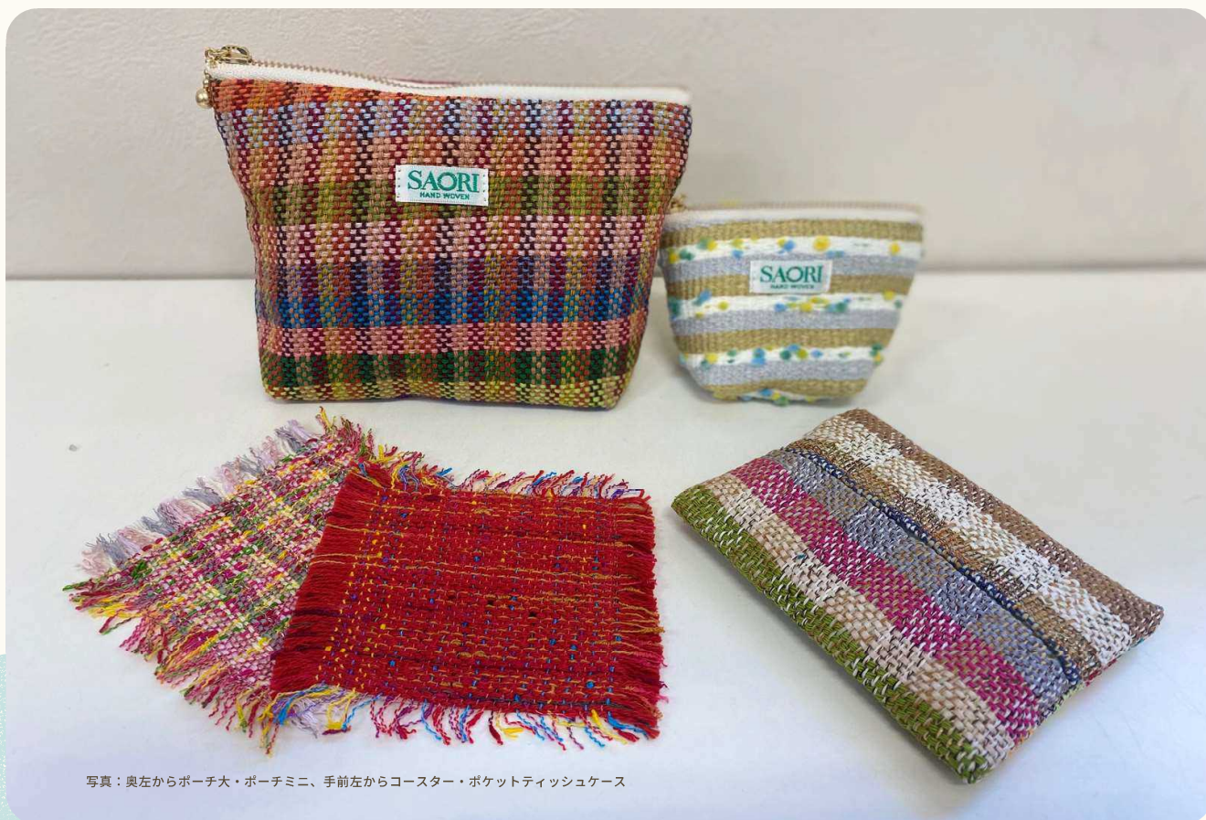
写真：奥左からポーチ大・ポーチミニ、手前左からコースター・ポケットティッシュケース