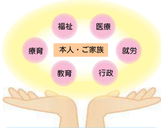
和歌山県発達障害者支援センター ポラリス

ポラリス は、全てのライフステージで一貫した支援ネットワークを構築するために、社会福祉法人愛徳園が和歌山県の委託を受けて設置した機関です。