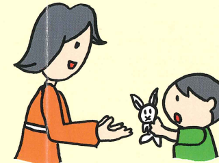
ちょうだい どうぞ