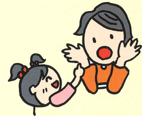
いない・いないばあ