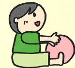
おすわり・ころころボール遊び