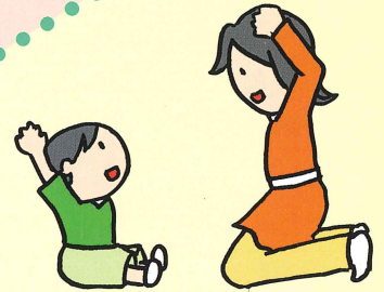
おすわり・手遊び