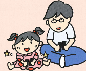
子どものまねっこ