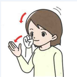
よろしくお願いします