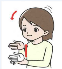
ありがとうございます